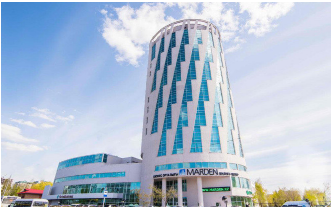
Схема местоположения Торгового представительства Российской Федерации в Республике в Казахстан